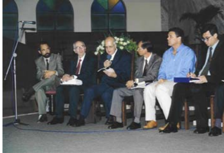
Sessão de perguntas do IV Encontro