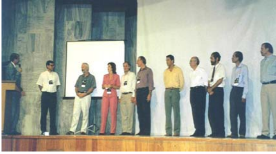
Encerramento do Encontro