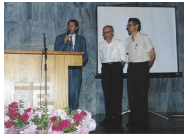
Homenagem aos 30 anos da SCB